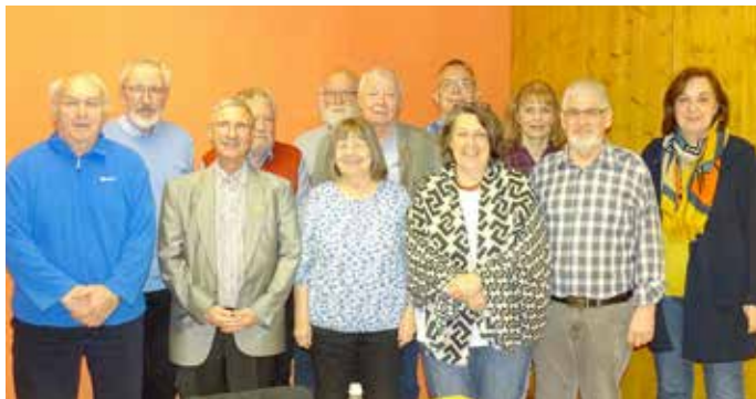
Die Vereinsleitung im Jahr 2023